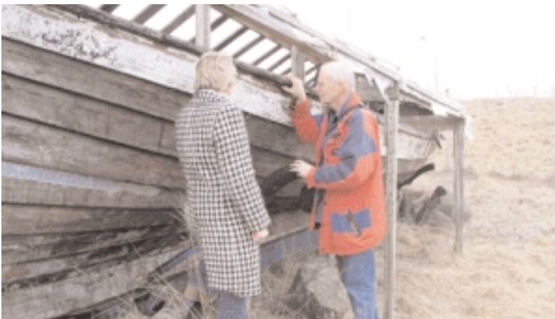
“Stolt siglir fleyið mitt.” Örn ráðsmaður sýnir áhugasamri konu af Vestfjörðum nafna sinn, bátinn Örninn, sem var þjóðargjöf Norðmanna í tilefni af ellefu-hundrað ára afmæli Íslandsbyggðar.