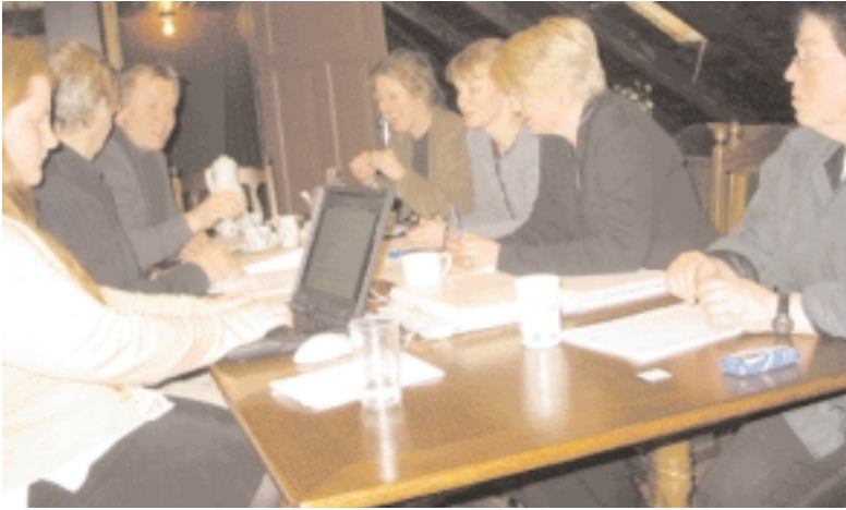
Rífa Laugaveginn? Samráðsfundur með starfsfólki Borgarskipulags.