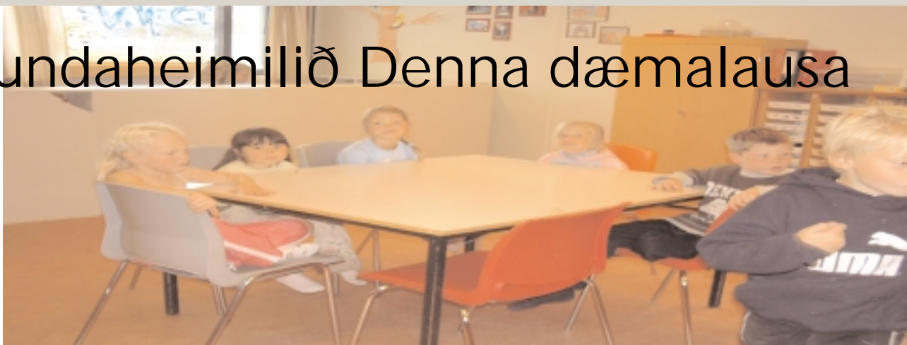
Á mánudögum fá börnin hressingu þegar þau koma úr skólanum - þau bíða spennu.