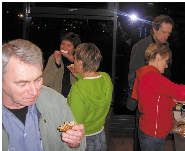
Eftir undirritun gæddi fólk sér á vöflum ...