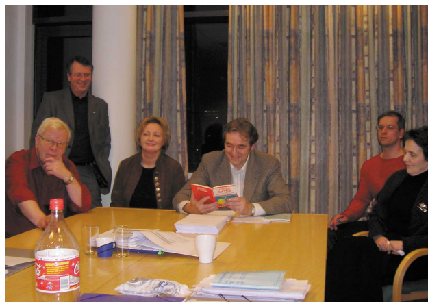
Samninganefnd Reykjavíkurborgar mætt á fund okkar... hvað bjóða þeir í þetta skiptið