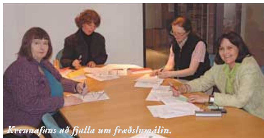
Kvennafans að fjalla um fræðslumálin.