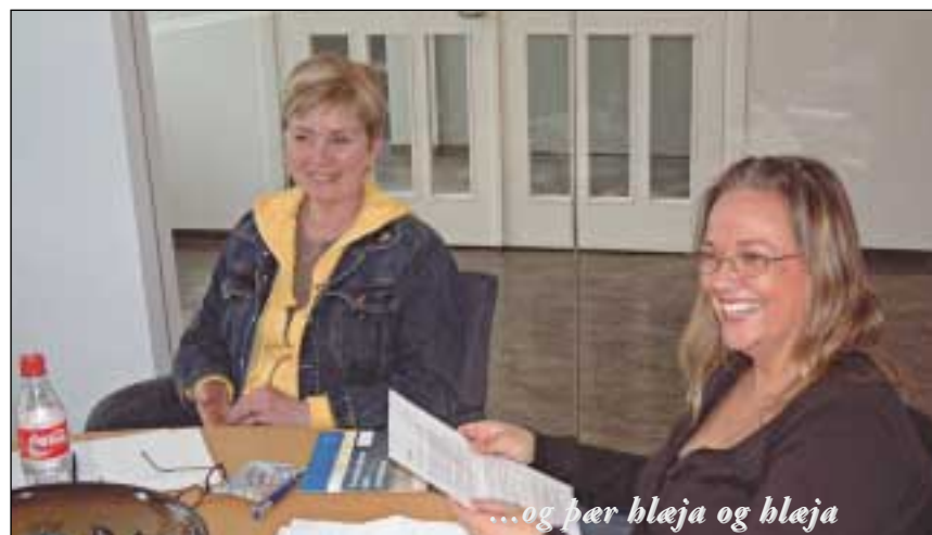
...og þær bléja og bléja