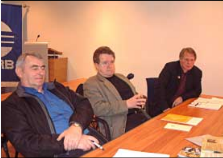
Fjörugar umræður um ímynd félagsins, upplýsingamál og þjóðfélagsmál