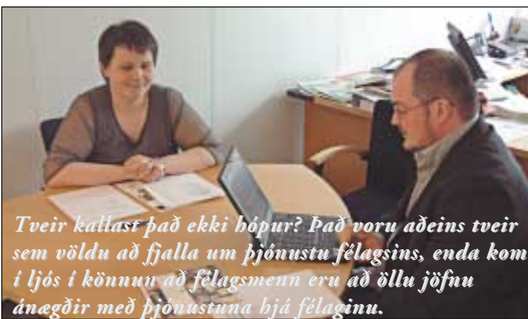
Tveir kallast það ekki hópur? Það voru aðeins tveir sem völdu að fjalla um þjónustu félagsins, enda kom í ljós í könnun að félagsmenn eru að öllu jöfnu ánægðir með þjónustuna hjá félaginu.