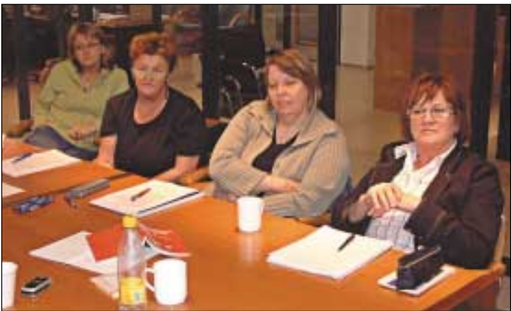
Starfsmatið og upplýsingar til félagsmanna - þar voru heitar umræður