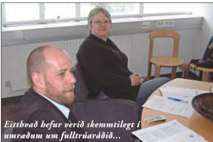
Eittbvað hefur verið skemmtilegt í umræðum um fulltrúaráðið...