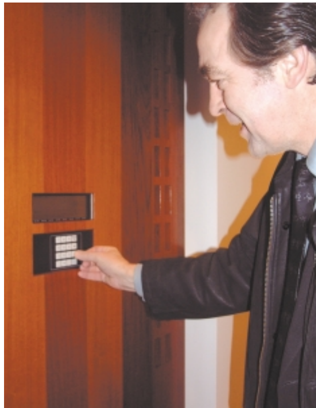
Fyrstur að morgni – síðastur heim.