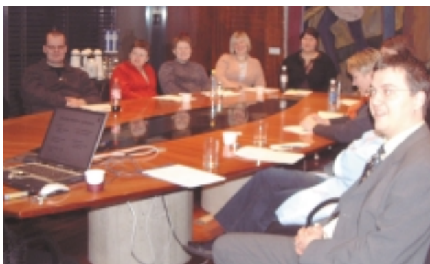
Áhugasamir starfsmenn á námskeiði...