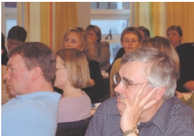
Fulltrúar aðildarféлага BSRB hlusta af mikilli athygli á erndi, en auk þess voru venjuleg aðalfundarstörf á dagskrá