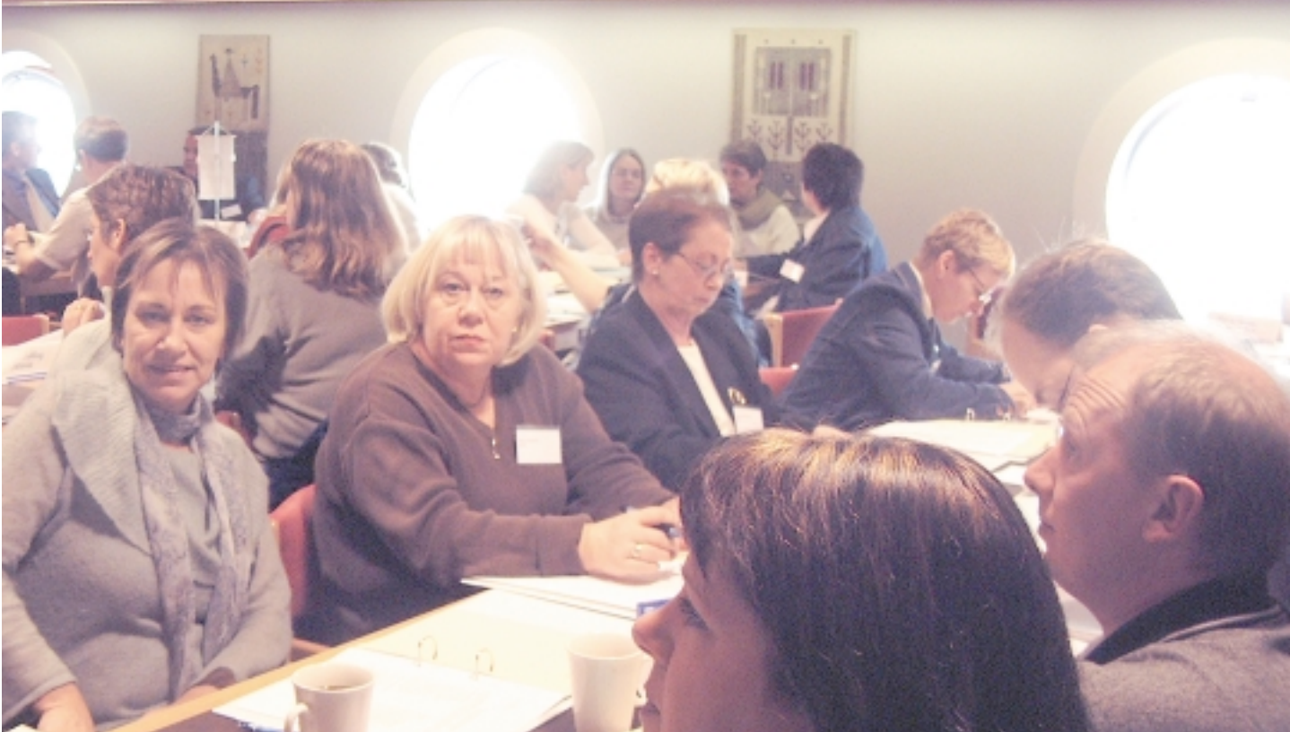
Fulltrúar Starfsmannafélags Reykjavíkurborgar voru 27 á 40. þingi BSRB sem fram fór dagana 22.-24. október sl. Fulltrúarnir tóku virkan þátt í málefnanefndum og umræðum sem fram fóru á þinginu