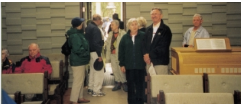
Hópurinn átti notalega stund í kirkjunni en saga hennar og ekki síður kirkjugarðsstæðisins ber samheldni þessa bæjarfélags gott vitni.

Að venju var efnt til sumarferðar 14. deildar félagsins og að þessu sinni voru dagarnir 23. og 24. júní valdir til ferðarinnar. Farið var frá Grettisgötu 89 snemma morguns og ekið austur um til Hvolsvallar þar sem að var stutta stund. Þá lá leiðin kringum Pétursey á leið að Kirkjubæjarklaustri og síðan var farið um Meðalland til baka að Skógum. Þar beið ferðalanga dýrindis kvöldverður með öllu tilheyrandi, sem menn gerðu góð skil. Gist var að Skógum um nóttina í mjög góðum herbergjum og seinni dagur byrjaði á veglegu morgunverðar hlaðborði. Flestir fóru og skoðuðu hið margrómaða byggðasafn að Skógum en um hádegi var svo lagt af stað, ekið var upp á Dyrhólaey og hið ægífagra útsýni þaðan skoðað þó rigningar suddi væri. Síðan var ekið sem leið liggur með auðvitað hefðbundnum stoppum til Þorlákshafnar.