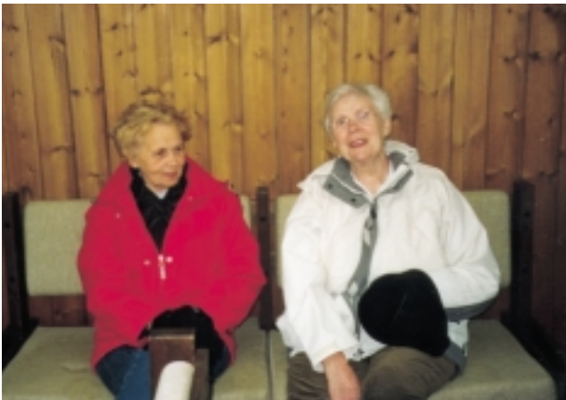
Tvær tilbúnar í slaginn.