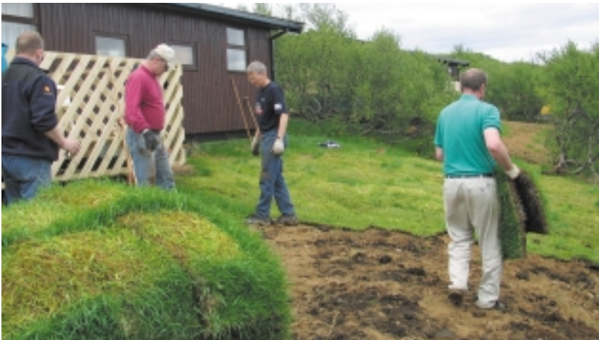
Duglegir sjálfbodaliðar í Munaðarnesi að ganga frá eftir miklar framkvæmdir.