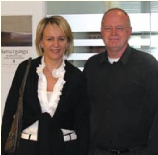
Borgarstjóri Hanna Birna Kristjánsdóttir kemur í heimsókn til félagsins stuttu eftir að hún tók við embætti.