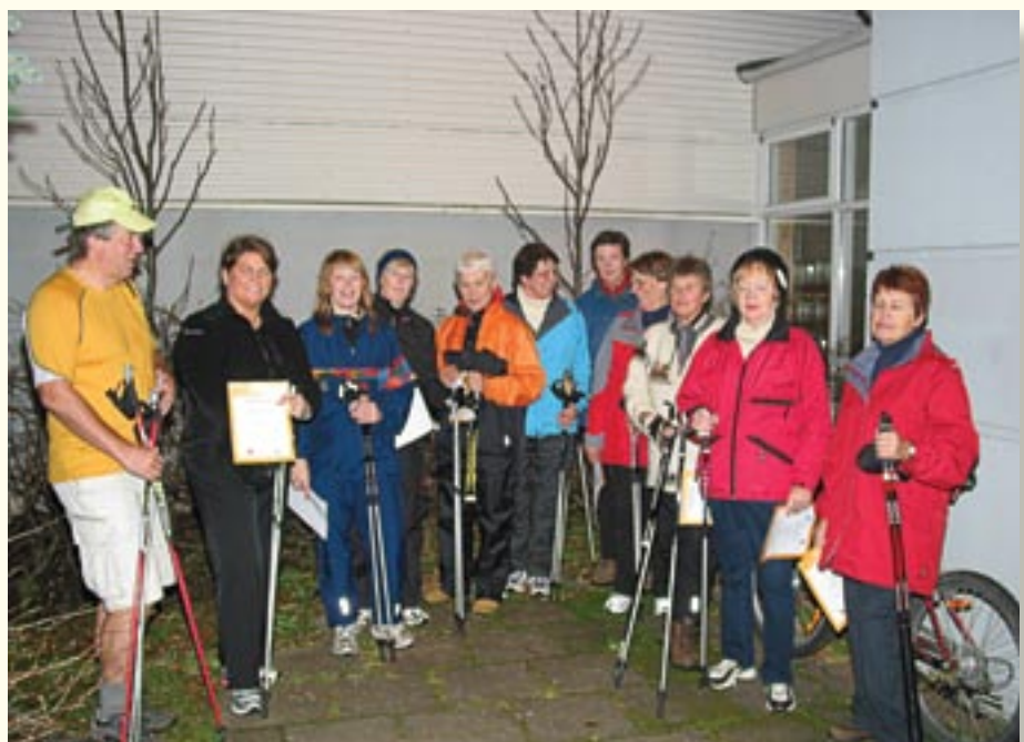
Félagsmenn á námskeiði í stafgöngu sem fer að mestu fram í Laugardalnum

Fræðslunefndin hefur fjallað um innihald námskeiðanna fyrir fulltrúa og trúnaðarmenn Samstíga til framtíðar . Sú nýjung varð á árinu að BSRB í samstarfi við Félagsmálaskóla alþýðu heldur nú öflugan trúnaðarmannaskóla. Í kjölfar þess fóru St.Rv. og SFR í endurskoðun á þeirri fræðslu, sem hefur verið í boði innan félaganna fyrir fulltrúa og trúnaðarmenn. Á árinu héldu félögin fjögur námskeið á vorönn með gamla laginu, tvö grunn og tvö framhaldsnámskeið. En á haustönn höfðu námskeiðin verið endurskoðuð út frá nýju skipulagi fræðslunnar og voru haldin tvö slík námskeið.