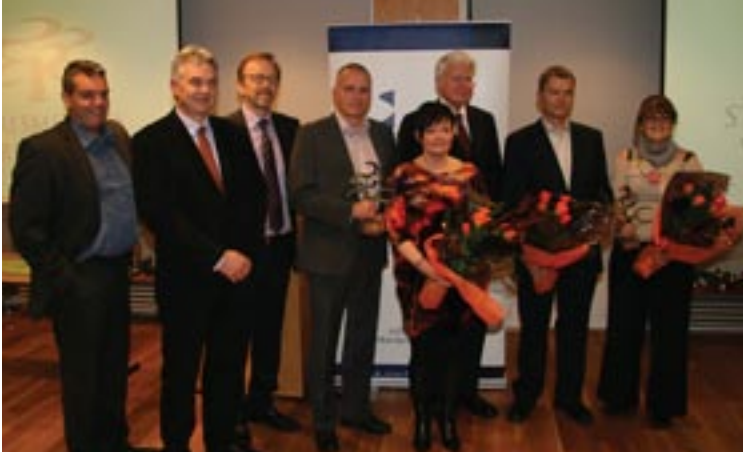
Vinningshafar ásamt forseta Íslands og fulltrúa Starfsmenntarráðs.

Forseti Íslands, Ólafur Ragnar Grímsson, afhenti Starfsmenntaverðlaunin við hátíðlega athöfn í BSRB húsinu í gær. Starfsmenntaverðlaunin eru veitt þeim aðilum sem vinna að framúrskarandi verkefnum í fræðslumálum og starfsmenntun. Tilgangur Starfsmenntaverðlaunanna er að styðja við nýsköpun og framþróun starfsmenntunar á Íslandi ásamt því að vekja athygli á málefnum. Verðlaunin eiga að vera verðlaunahöfum hvatning til áframhaldandi starfa og öðrum til fyrirmyndar á þessu sviði. Starfsmenntaráð veitti verðlaunin í síðasta sinn, en þau flytjast nú á hendur Fræðslumiðstöðvar atvinnulífsins. BSRB er aðili að Fræðslumiðstöðinni.