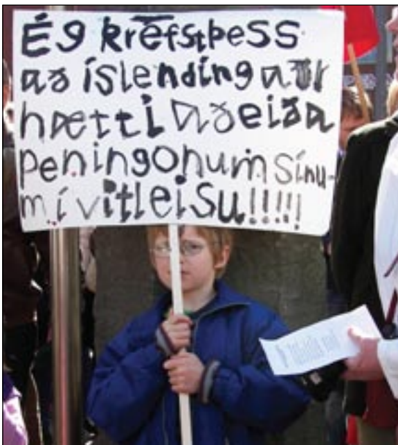
Snemma beygist krókurinn! Ungur mótmælandi í kröfugöngu 1. maí

Með þessum rétti er gott að bera fram Basmati hrísgrjón eða nan brauð