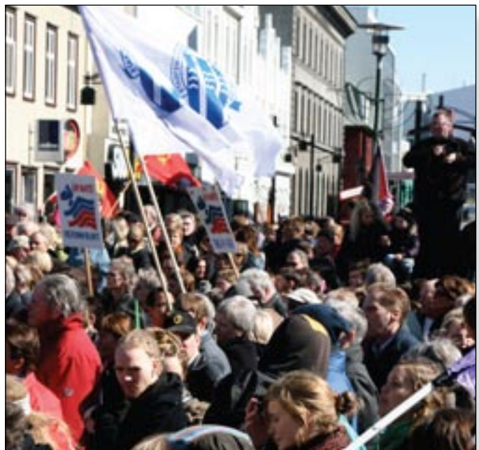
Fjöldmenni var í kröfugöngunni á 1. maí